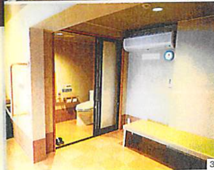
①入浴介助用リフトが使えるレークビュー貸切風呂。ホテルの温泉はどれも、低張性で湯あたりにくい。ため、ぼんやりと景色を眺めながら入浴できる ②レークビュー貸切風呂のシャワースペース。座って使え、浴槽との段差も少ない ③ベッドが入れる広さがある貸切風呂の脱衣所。トイレとの間も段差もなく全面フラット