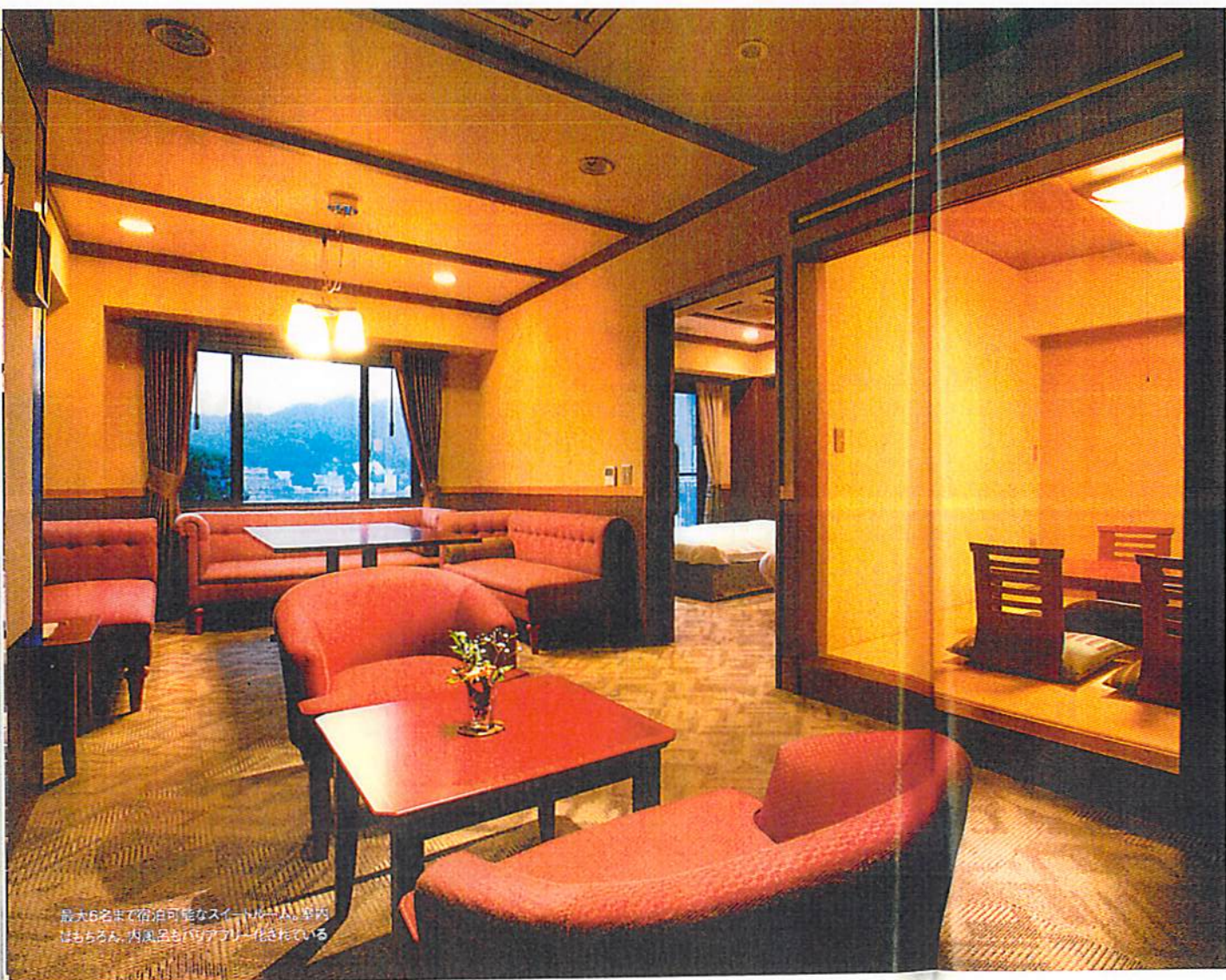
最大6名まで宿泊可能なスイートルーム。室内はもちろん、内風呂もバリアフリー化されている